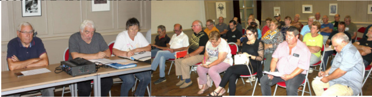
Réunion du mardi 19 septembre 2023