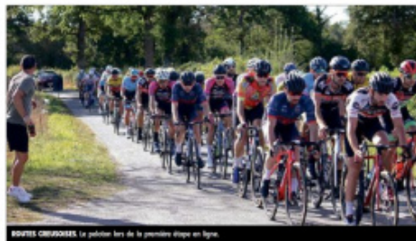
ROUTES CREULOISES. La peloton lors de la première étape en ligne.